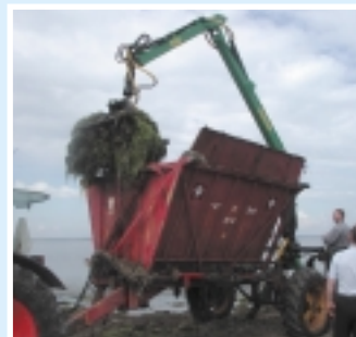
Optagning af ålegræs på de mønske strande.