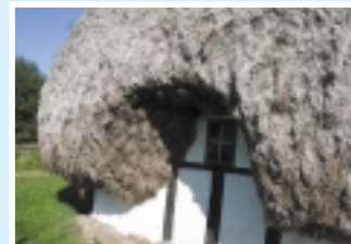
Historisk bygning på Læsø, istandsat med tang fra de mønske strande.