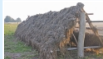
Torring af ålegræs fra de mønske strande